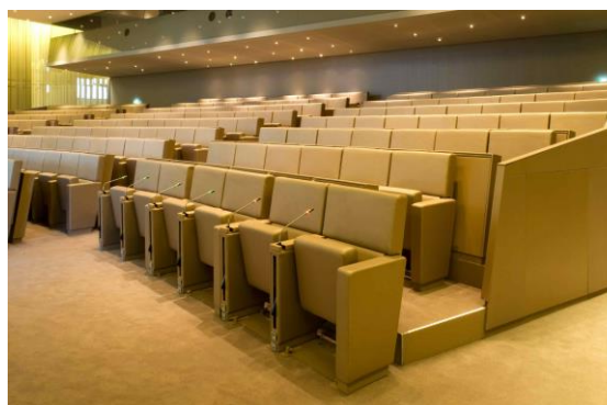
PARIS - IBM