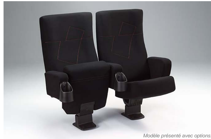
Modèle présenté avec options.