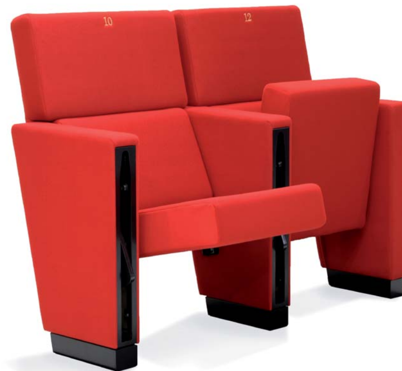
MODELE ILLUSTRE COMPORTANT DES OPTIONS OPTIONS NOT INCLUDED IN STANDARD MODEL